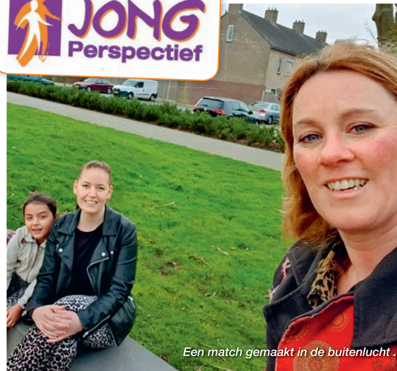
Een match gemaakt in de buitenlucht.