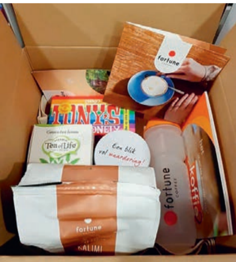
Als blijk van waardering verraste de gemeente de bezochte bedrijven met een koffie- en theepakket van het Zoetermeerse bedrijf Fortune Coffee.

De wethouders waren vooral benieuwd naar hoe het met de ondernemers gaat in het jaar van Covid-19. Daarnaast grepen ondernemers de kans aan om allerhande vragen te stellen, maar ook zaken te delen waar men tevreden over is. In plaats van taart werd er dit jaar een pakket met koffie, thee en wat lekkers, als hart onder de riem, naar de bezochte bedrijven gestuurd.