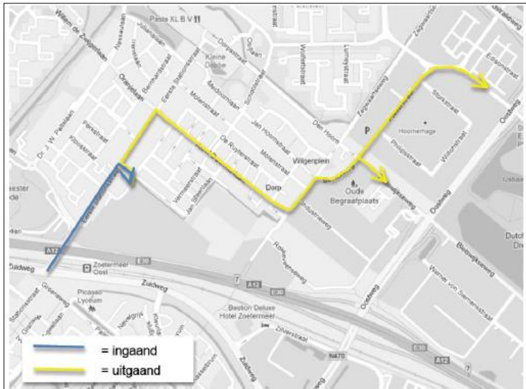
Afbeelding 1: Huidige routing vrachtverkeer Nutricia