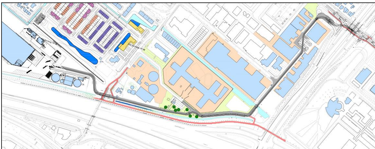
(Afbeelding 2: overzicht voorstel ontsluitingsroute)