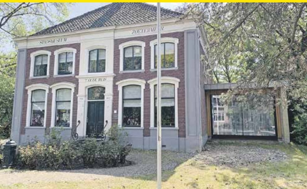
Project: 't Oude Huis, Dorpsstraat 7, Zoetermeer

De Balijhoeve werd gebouwd in 1992 als modelkinderboerderij voor de Floriade. Het hoofgebouw is nu gerenoveerd en net als de stallen uitgebreid. De nieuwe uitbreidingen en overkappingen sluiten naadloos aan op de oorspronkelijke gebouwen en karakteristieke daken.