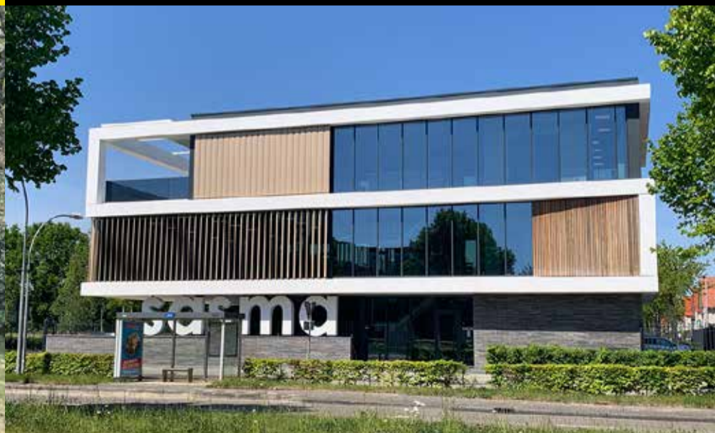
Project: Kantoorgebouw Sasma, Willem Dreeslaan 301, Zoetermeer

Dit statige Rijksmonument uit 1872 is gebouwd als burgemeesterswoning. Daarna werd het tandartsenpraktijk, gemeente-kantoor en tot 2018 Stadsmuseum Zoetermeer. De nieuwe uitbreiding voor trainingen is zorgvuldig ingepast in de beeldentuin en zoekt het contrast met het oude gebouw.