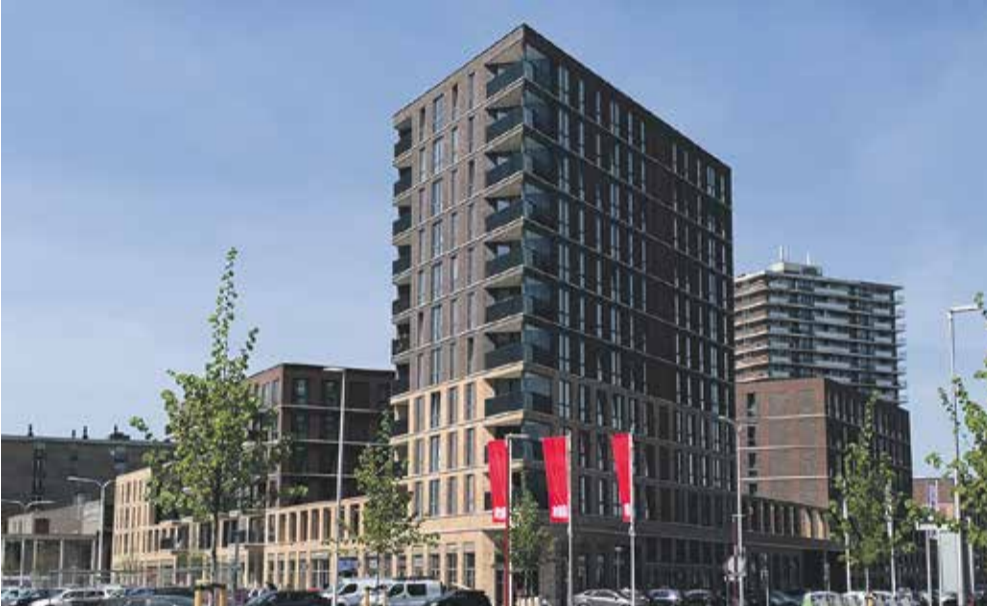
Project: Stadskwartier Palenstein, Schepenveld e.o. Zoetermeer

Het open onderwijsconcept komt terug in de opzet van het gebouw. In het middengebied liggen de leerateliers met thema's zoals theater, bouwatelier en huishoek, media-atelier en ontdek-atelier. Kindergericht, talentgericht en toekomstgericht zijn de kernwoorden.