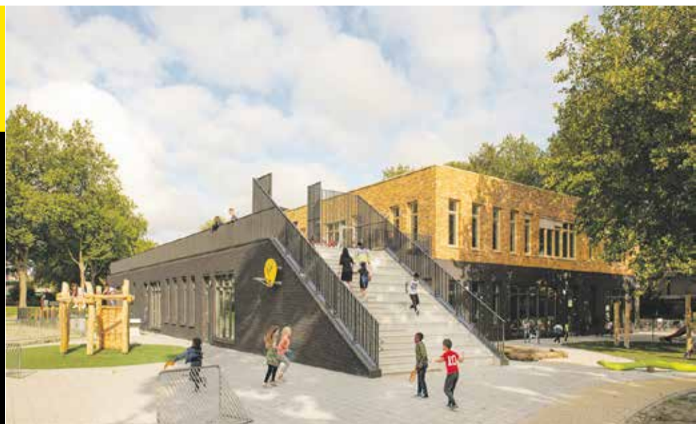
Project: Kindcentrum De Entree, Overwater 1, Zoetermeer ONTWERP: LIAG architecten OPDRACHTGEVER: GEMEENTE ZOETERMEER / UNICOZ Uitdagende leeromgeving

Vijf gebouwen die de afgelopen twee jaar zijn gebouwd, zijn genomineerd. Een vakjury bepaalt welke architect de Gemma Smid Architectuurprijs krijgt. Daarnaast krijgt het gebouw met de meeste stemmen de eretitel Gemma Smid Publieksprijs 2022. Welk gebouw vindt u het mooist? U kunt stemmen tot zaterdag 18 juni 15.00 uur via www.architectuurpuntzoetermeer.nl/architectuurprijs .