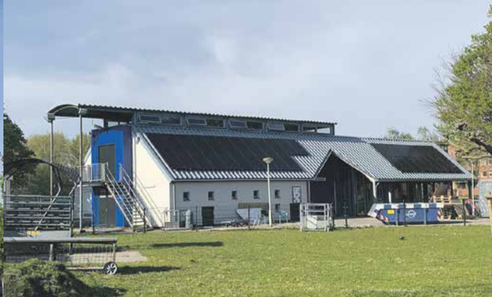
Project: Stadsboerderij Balijhoeve, Adres: Kurkhout 100, Zoetermeer

Het appartementengebouw met winkels heeft hoogteaccenten, doorkijkjes tussen de torens en verhoogde binnentuinen. Het plein vormt het hart van een nieuw leefmilieu in Palenstein. Van een anonieme omgeving werd een woon- en werkgebied gemaakt dat rondom varieert in sfeer.