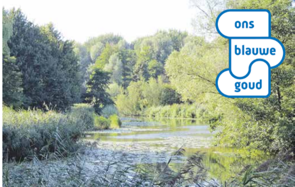
Voorbeeld van natuurlijke oevers (Westerpark)

In het project Ons Blauwe Goud, werken we samen met het Hoogheemraadschap