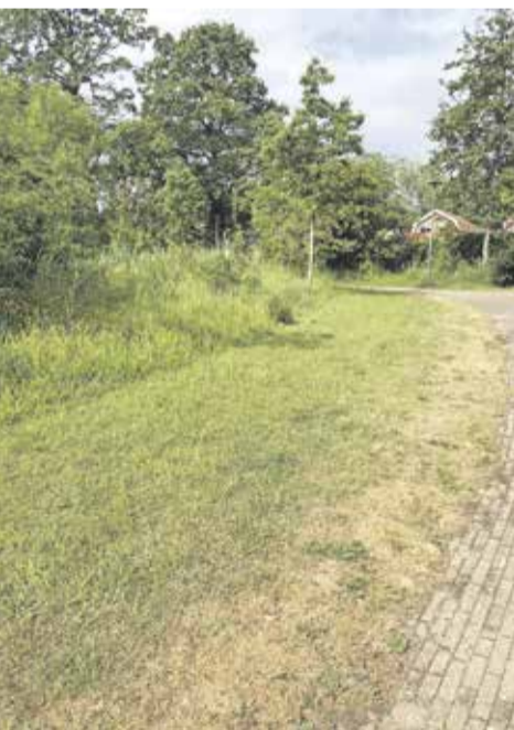
Voorbeeld van gazon dat door droogte geel verkleurd

In Nederland hebben we altijd een teveel aan water gehad. Dat komt doordat we voor een groot deel onder de zeespiegel leven en veel rivieren hebben. Met een dalende bodem en een stijgende zeespiegel, zou u denken dat we met teveel water zitten. Alleen: het overtollige water uit de bodem voeren de waterschappen zo snel mogelijk af. En wanneer het regent, valt er steeds vaker veel water in een keer: dit noemen we piekbuien. Om bij regen droge voeten te houden, voeren de waterschappen ook het regenwater zo snel mogelijk af. Nu de periodes zonder regen steeds langer worden, komt er minder water bij in rivieren, beken en sloten. Doordat we water na een piekbui zo snel mogelijk weer afvoeren, ontstaat er een watertekort wanneer de regen uitblijft. We moeten daarom gaan omdenken: het water van (piek)buien opvangen en verzamelen. En het water pas bij droogte weer vrijgeven.