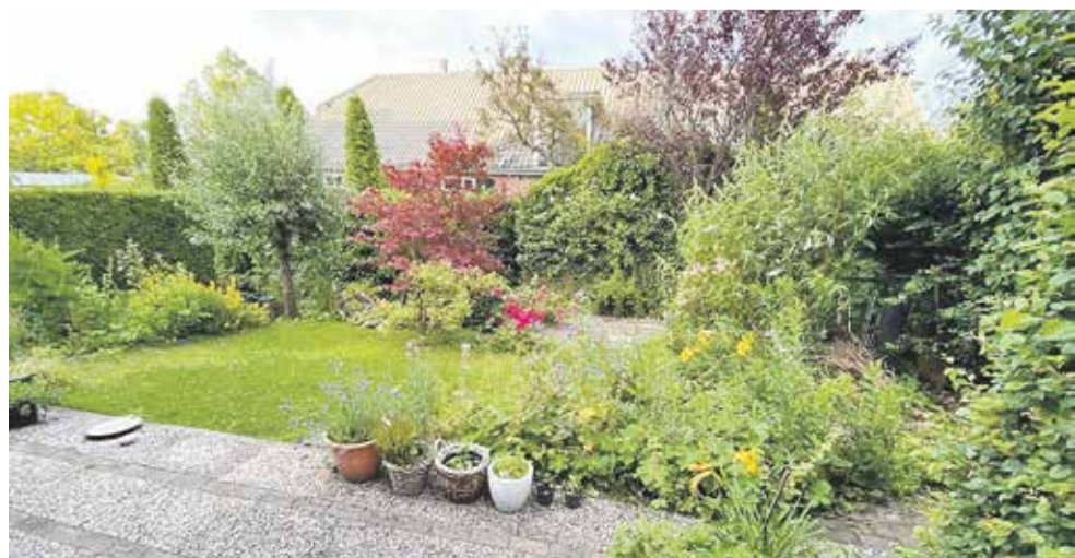
Voorbeeld van een natuurvriendelijke tuin. Minder tegels en meer groen