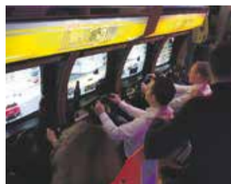
Nationaal Videogame Museum

sportteam of klasgenoten bij het Nationaal Videogame Museum. Een uniek, interactief museum midden in het centrum van Zoetermeer met meer dan 200 games die allemaal op free-play staan! Bekijk alle tien plekken op www.zoetermeerisdeplek.nl/teamuitjes . Aanvullingen of suggesties op deze top 10? We horen het graag!