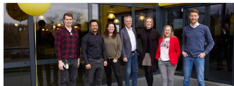
Team Applied Data Science & Artificial Intelligence voor de ingang van de Dutch Innovation Factory.

Studeren bij De Haagse Hogeschool in Zoetermeer is uniek. Op deze kleinschalige locatie zien we u graag en werken we teamgericht. Samen met uw medestudenten en ondernemers in de Dutch Innovation Factory werkt u aan projecten met echte impact op de omgeving! Meer weten over de opleiding? Kijk op www.dehaagsehogeschool.nl onder Bacheloropleidingen bij Applied Data Science & Artificial Intelligence.