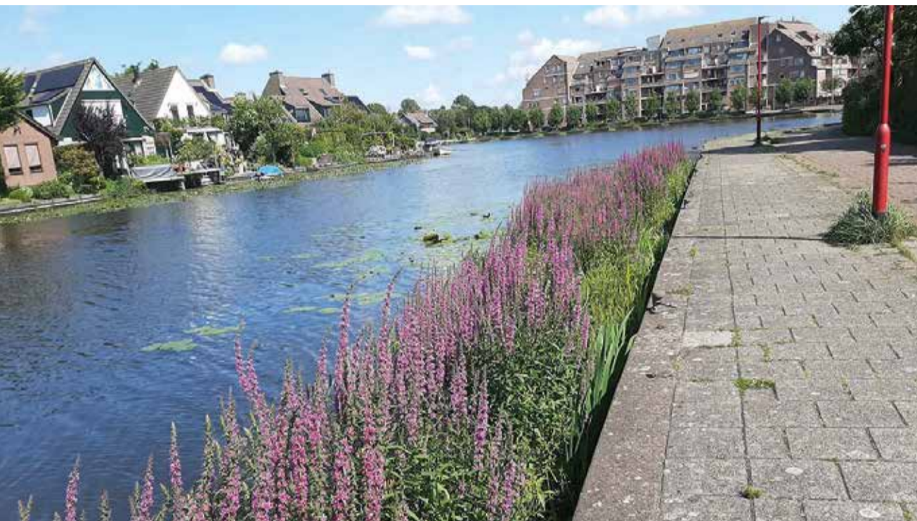
De drijvende eilanden aan de Broekwegwetering staan prachtig in bloei

In de herfst is het een drukte van belang. De grote vogeltrek is nu in volle gang. Vreemde gasten maken een tussenlanding, eten hun buiken vol en gaan weer op reis. Egels zoeken een veilig onderkomen voor een winterslaap en eten hun buikjes rond. Een laatste grote dikke hommelt zwalkt rond op zoek naar een geschikte plek om te overwinteren. Het is een koningin. Volgend jaar sticht ze weer een nieuw volk. In onze stad willen we zoveel mogelijk verschillende soorten de ruimte geven om te kunnen leven. Een gekleurd pallet aan variatie waar je van kunt genieten. In deze editie geven we u een sneak preview van een paar projecten waar we bouwen aan meer biodiversiteit en waar u straks van kunt genieten.