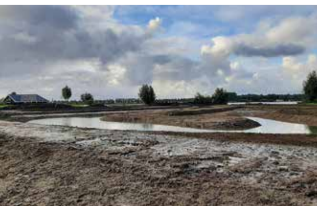
Moerasparel in aanleg bij de Zoetermeerseplas

Langs de Zoetermeerseplas komen langs de oevers moerasparels. Het zijn ondiepe poelen en lagunes met water- en moerasplanten die leefruimte bieden aan veel dieren zoals kikkers, libellen en vogels, waaronder ook het