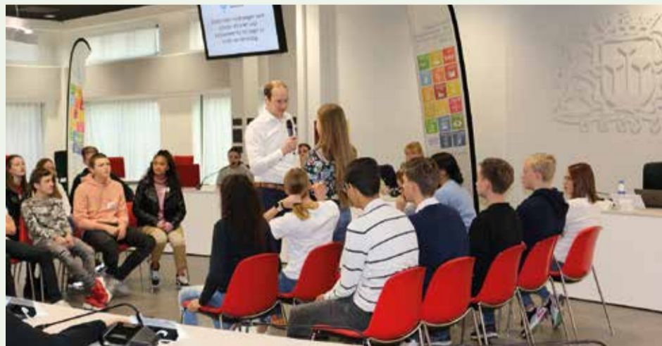
Vorig jaar tijdens de jaarlijkse debatwedstrijd 'Stadhuis van Democratie'.

met de 10e editie. Tijdens project gaan scholieren van het primair onderwijs, het