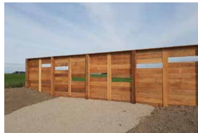
Achter het kijkscherm in Buytenpark kunt u de grutto spotten