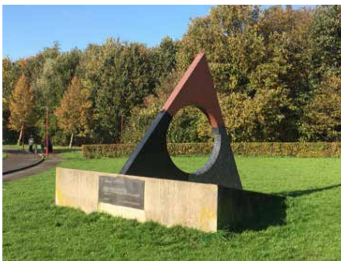
J.G.T.M. Taudin Chabot - Zonnewijzer

Beeldende kunst verbindt mensen met hun stad en geeft een eigen identiteit aan een plek. Dat maakt kunst een belangrijk onderdeel van de stadscultuur. De gemeente Zoetermeer verstrekt al decennialang opdrachten aan professionele kunstenaars om bij bouwprojecten een kunstwerk te maken. Een kunstwerk speciaal ontworpen voor de plek en speciaal voor de mensen die de plek gebruiken.