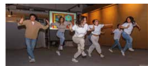
Dansers tijdens de culturele wandeling bij Kunstgarage Franx door Richard Jetten.

Het UITfestival Zoetermeer 2021 zit er alweer op! Van 10 t/m 19 september werd het culturele seizoen afgetrapt met leuke activiteiten door heel de stad. Van een culturele wandeling langs zes culturele plekken in Zoetermeer tot theater, dans, zang, film en workshops in de wijken, het was weer feest dit jaar!