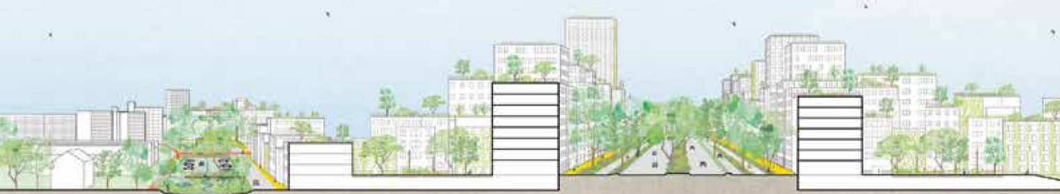
Doorsnede van de nieuwe Stadswijk Entree met in het midden de stadsstraat Afrikaweg.