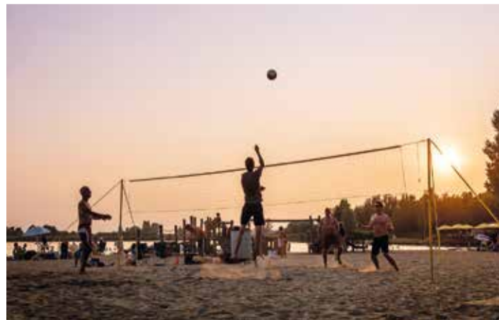
Foto van volleyballers op het Noord Aa.

Kids hoeven zich deze zomer niet te vervelen! Bezoek de Zoetermeerse speelbossen zoals Bentjungle en De Balij, buitenspeeltuinen Westerpret, speelparadijs Avontura, Boerderij 't Geertje en nog veel meer! Hebben jullie het nieuwe Speelmeer Paspoort 2021 al in huis? Download 'em via www.speelmeer.nl .