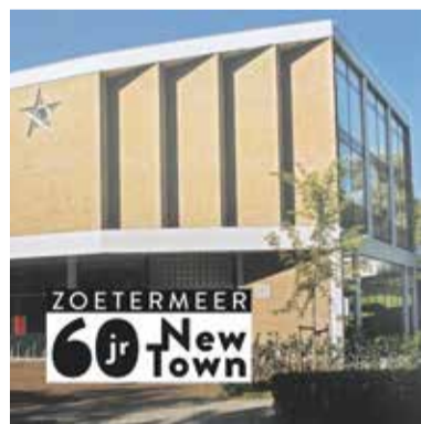
Dorp - Architectuurwandeling met gids

Vooravond. Ze werd in vijf jaar tijd vier keer genomineerd voor het beste theaterlied en won de Annie M.G. Schmidtprijs met Er spoelen mensen aan.