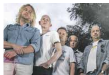
The Eagles Legacy - Poppodium Boerderij

bijblijven! Dinsdag 24 mei kunt u Ballad of a White Cow bekijken. Het verhaal over Mina, die hoort dat haar man Babak een jaar eerder ten onrechte is geëxecuteerd. In belang van haar dochter en haarzelf start ze een stil protest tegen het systeem. Hierbij ontmoet ze Reza, die beweert een oude vriend van Babak te zijn. Ze neemt hem in vertrouwen, niet wetende wat het verband is dat ze bij elkaar bracht.