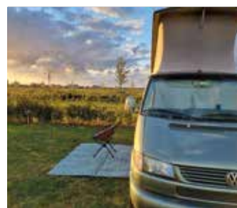
Camping Drie Morgen

In de boerderijwinkel die op de camping is gevestigd, worden verschillende verse groenten, fruit, kaas, eieren, sappen en honing verkocht. Ontdek nog meer over het recreatiegebied op www.zoetermeerisdeplek.nl/n3mp/