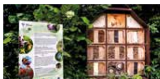
Bijen- en insectenhotel

Het Westerpark is ook onderdeel van de architectuurwandeling van de wijk Meerzicht. Zowel voor inwoners uit Zoetermeer als voor de bezoekers van de stad zijn deze wandelingen een verrassende ontdekkingstocht die u per fiets of te voet kunt volgen. U vindt de architectuurwandeling op www.zoetermeerisdeplek.nl/wandelingmeerzicht . Wilt u meer ontdekken over de natuur in Zoetermeer? Neem een kijkje op www.zoetermeerisdeplek.nl/in-de-natuur/