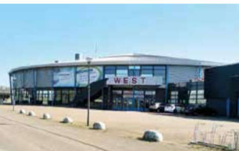
Vaccinatielocatie Silverdome in Zoetermeer sluit vanaf 16 augustus

Bijna iedereen die in aanmerking komt voor een vaccinatie is inmiddels geheel of gedeeltelijk gevaccineerd, heeft een afspraak ingepland of heeft een uitnodiging ontvangen. In de regio Haaglanden zijn er al ruim 1.000.000 prikken gezet. Vanaf 16 augustus gaat de GGD een aantal grote vaccinatielocaties sluiten. Het gaat om