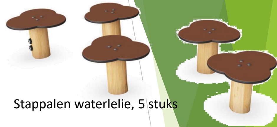
Stappalen waterlelie, 5 stuks